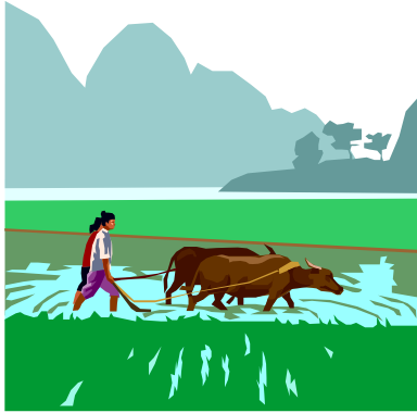
جووتیار زه‌وی ده‌کیلیت