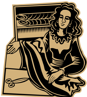
بازرگان کوتال ده‌فرۆشیت