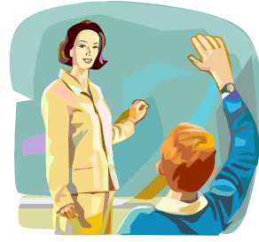
مامۆستا قوتابی فیڕ ده‌کات