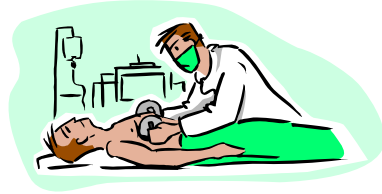
دکتۆر نه‌خۆش چاره ده‌کات