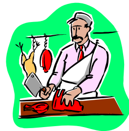
قه‌ساب گوشت ده‌فرۆشیت