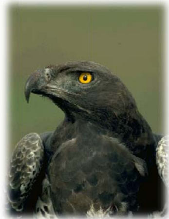
ههلو (می: تهوار)