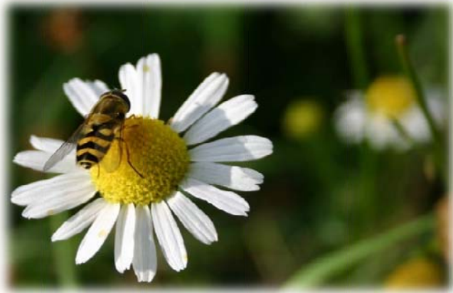
ههنگ / میشه ههنگوین