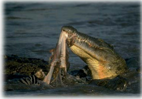
سووسمار / تیمساح / کرۆکۆدیل