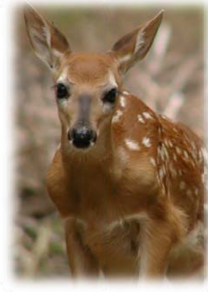
ئاسک / مامز / کار مامز